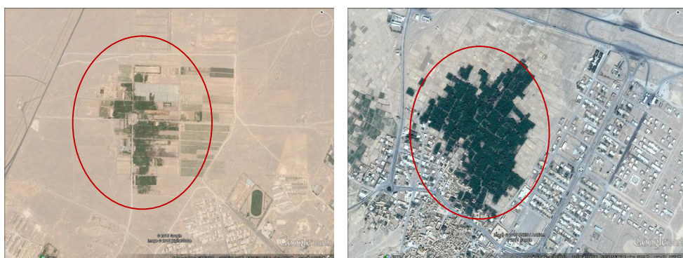
شکل ۱- تصاویر ماهواره‌ای مناطق دوگانه آزمایشی عقدا (راست) به مساحت ۴۵ هکتار و مهریز (چپ) به مساحت ۱۲ هکتار. مناطق هدف در برنامه رهاسازی حشرات نابارور کرم گلوگاه انار با دایره قرمز رنگ نشان داده شده است. تصاویر با استفاده از نرم افزار Google Earth نسخه 7.1.5.1557

برای تخمین جمعیت دوم از حشرات موجود در باغ که معادل نسل اول آفت در باغ آزمایشی می‌باشد اقدام به تخمین جمعیت حشرات آفت در زمان پیش‌بینی شده بر اساس روز-درجه مربوط به کرم گلوگاه انار (در حدود ۶۴۵ روز-درجه برای یک نسل) بر اساس داده‌های دمایی مناطق دو گانه شد. لازم به ذکر است به دلیل نبود اطلاعات در زمینه زمان فیزیولوژیک کرم گلوگاه انار در شرایط اقلیمی کشور از روز-درجه تعریف شده در سایت IPM دانشگاه کالیفرنیا که تقریباً معادل ۶۴۵ روز-درجه می‌باشد استفاده شد. پس از دو مرحله تخمین جمعیت وحشی ارزیابی تعداد حشره لازم برای رهاسازی بر اساس فرمول ۷ تا ۹ برابر جمعیت (و گاه ۱۲ برابر جمعیت) اقدام به رهاسازی حشرات عقیم گردید. لازم به ذکر است در رهاسازی صفر بر علیه پستانها و رهاسازی نسل اول در حدود ۲۰ برابر جمعیت وحشی حشرات عقیم رهاسازی شدند (جدول ۲).