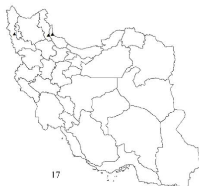
شکل‌های ۱۴-۱۷- نقشه پراکنش گونه‌ها در ایران: ۱۴- Acanthaclisis occitanica morpha typical - ۱۵- Synclisis baetica - ۱۶- A. obscura - ۱۷- A. occitanica morpha nigrilenta

Figs. 14-17. Dot distribution map of species in Iran: 14. Acanthaclisis occitanica morpha typical, 15. A. occitanica morpha nigrilenta, 16. A. obscura , 17. Synclisis baetica .