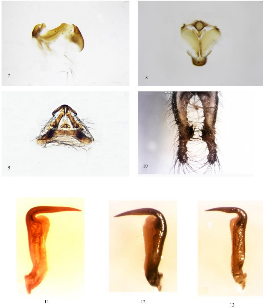
شکل های ۷-۱۳-۸، ۷-۸- نمای جانبی و پشتی اندام زادآوری حشره نر Acanthaclis occitanica morpha typical، ۹- نمای پشتی اندام زادآوری حشره نر Centroclis cervina ، ۱۰- نمای شکمی اکتوپراکت حشره نر A. occitanica morpha typical، ۱۱- مهمیز ساق A. occitanica morpha typical، ۱۲- مهمیز ساق A. obscura ، ۱۳- مهمیز ساق Synclis baetica

Figs. 7-13. 7, 8. Lateral and dorsal view of male genital of Acanthaclis occitanica morpha typical, 9. Dorsal view of male genital of Centroclis cervina , 10. Ventral view of male ectopract of A. occitanica morpha typical, 11. Tibial spur of A. occitanica morpha typical, 12. Tibial spur of A. obscura , 13. Tibial spur of Synclis baetica