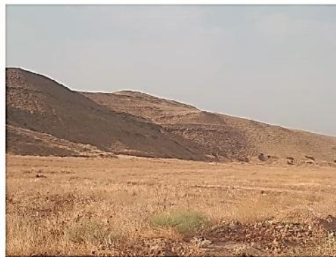
شکل ۸- زیستگاه A. limbatus در استان ایلام، شهرستان مهران (اوایل پاییز ۱۳۹۷).