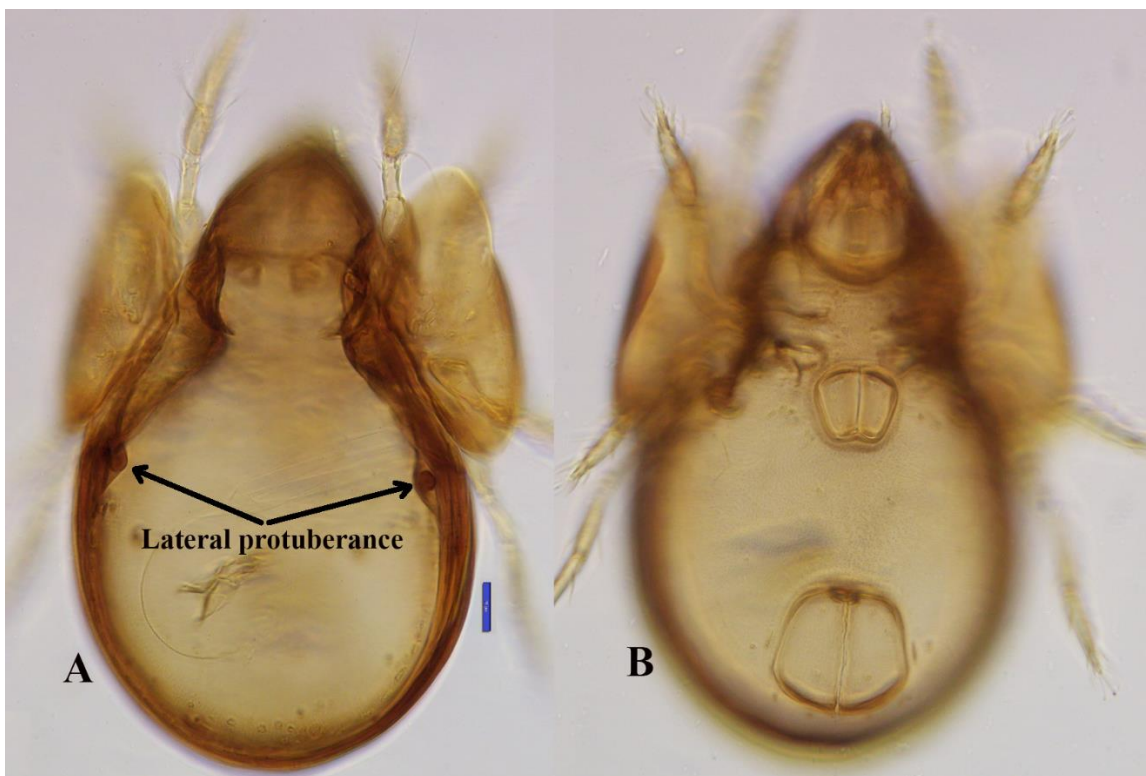
شکل ۳- کنه Cryptogalumna grandjeani : A- نمای پشتی، B- نمای شکمی (مقیاس: ۱۰۰ میکرومتر) Fig. 3. Cryptogalumna grandjeani : A- Dorsal view, B- Ventral view (Scale: 100 \mu m)